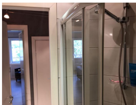
Bildet viser dør i våtsone.